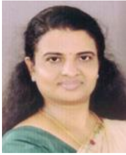
നിഷ പൂത്തൻപുരയിൽ മെമ്പർ ഡിവിഷൻ-1 അഴിയൂർ