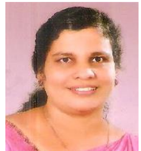
കെ.പി.ഗീരിജ വടകര പൗരാവകാശ രേഖ