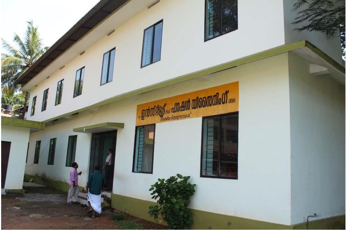
ജി.ഐ.എഫ്.ഡി. മലപ്പുറം, കോഴിക്കോട്