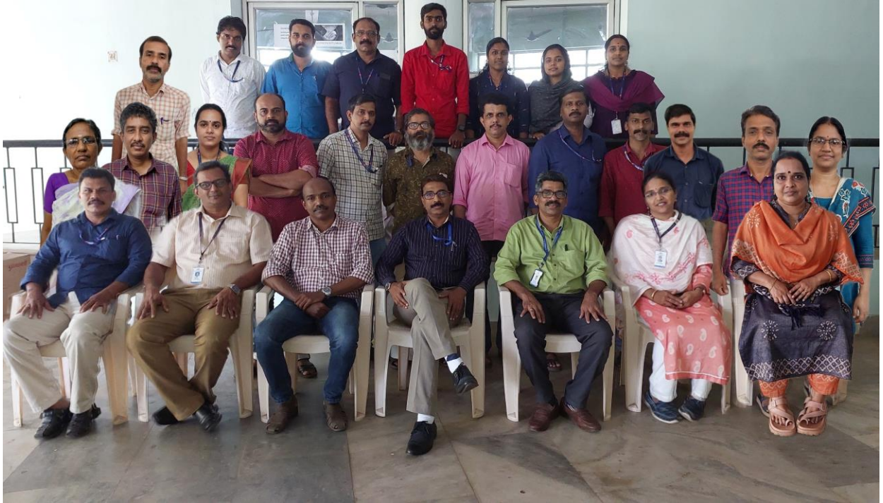
ജില്ലാ പഞ്ചായത്ത് ജീവനക്കാർ