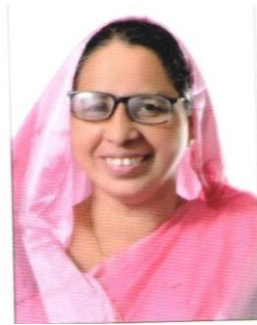
റസിയ തോട്ടായി മെമ്പർ (ഡിവിഷൻ 20 - നന്മണ്ട)