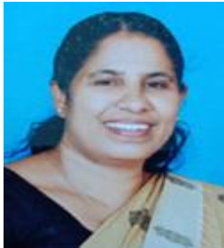
സി.എം.യശോദ മെമ്പർ ഡിവിഷൻ-5 കുറ്റാടി