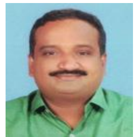
അഡ്വ.പി.ഗവാസ് മെമ്പർ ഡിവിഷൻ-15 കടലുണ്ടി പൗരാവകാശ രേഖ