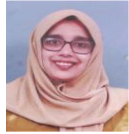
പി.ടി.എം.അനുമുനീസ ടീച്ചർ മെമ്പർ ഡിവിഷൻ-18 മടവൂർ