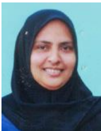
വി.പി.ജമീല ഡിവിഷൻ-11 തിരുവമ്പാടി