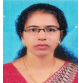
പി.പി.പ്രേമ മെമ്പർ ഡിവിഷൻ-8 ബാലുശ്ശേരി