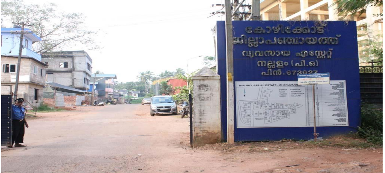
നല്ലൂം വ്യവസായ എസ്റ്റേറ്റ്