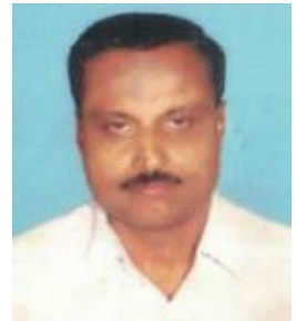
നാസർ എസ്റ്റേറ്റ് മുക്ക് മെമ്പർ ഡിവിഷൻ-12 ഓമശ്ശേരി