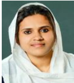
റംസിന നരിക്കുനി മെമ്പർ ഡിവിഷൻ-7 കട്ടിപ്പാറ