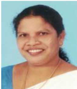
അംബിക മംഗലത്ത് മെമ്പർ ഡിവിഷൻ-9 ഈങ്ങാപ്പുഴ