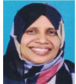
നജ്മ.സി.വി.എം മെമ്പർ ഡിവിഷൻ-3 നാദാപുരം